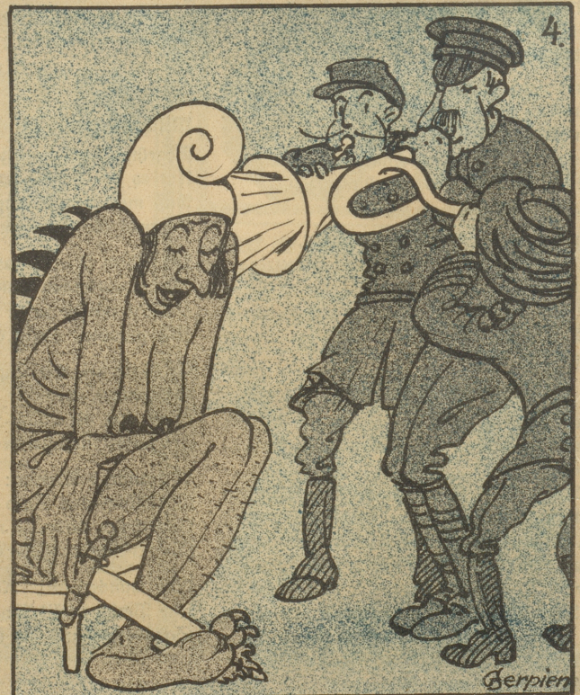
Seit die russische Kriegsfurie diese Kappe über die Ohren gezogen hat, ist sie nicht mehr zu erwecken.