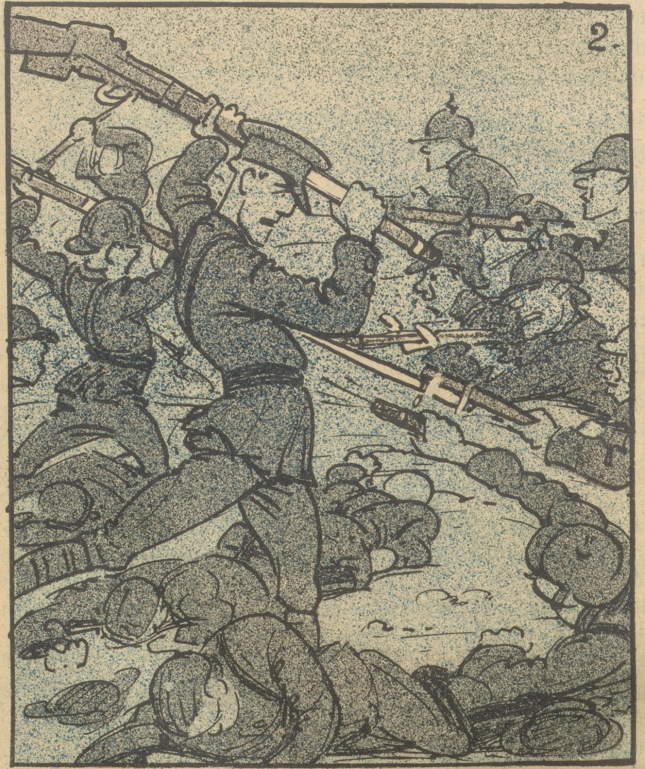
Wenn die Menschen endlich begreifen wollten, daß wir sie für ihre eigene Freiheit — totschlagen.