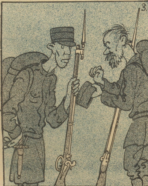
Außer einem Bajonett habe ich schon lange nichts mehr im Magen gehabt.