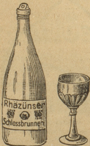
Goldene Medaille: Chur 1913

das wohlbekömmlichste Schweizer Tafelwasser für jedermann, sprudelt warm (20°C) aus der Erde, aus dem alkal.-salin. Sauerbrunnen Rhätüns, Graubünden, hervor!