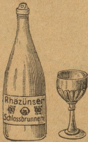
Goldene Medaille: Chur 1913

Sauerbrunnen Rhazüns, Graubünden, hervor!