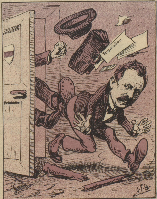
Gemeint war's gut, gesprochen zahn, die Wirkung aber war infam.