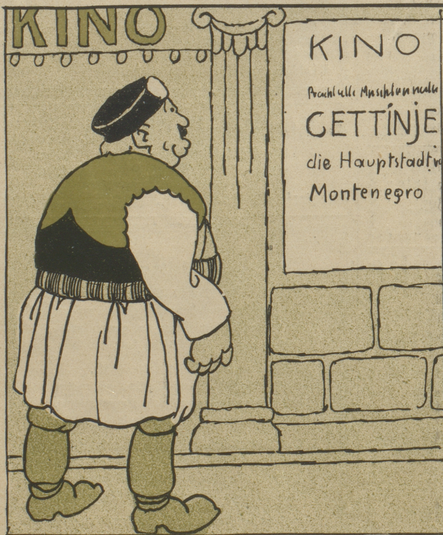
Eine Erfindung für evakuierte Könige

„Ich kann, wenn ich will, täglich meine Hauptstadt sehen.“