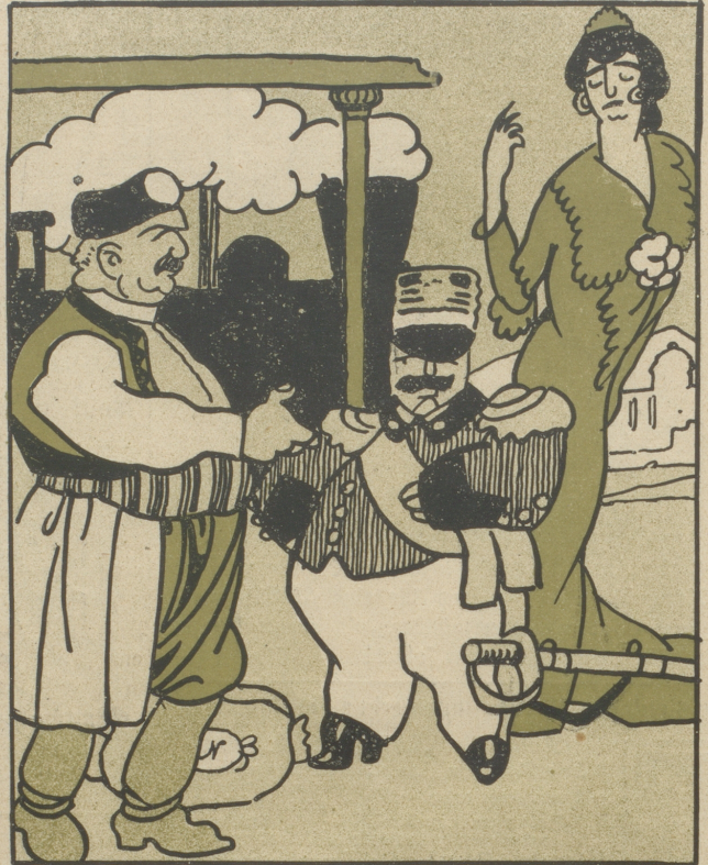
Die armen Verwandten

„Wir begreifen, daß du dich in dieser vornehmen Umgebung nicht wohlfühlen kannst.“