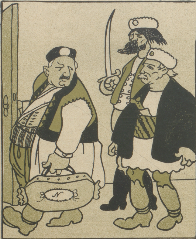
Disposition vor der Abreise