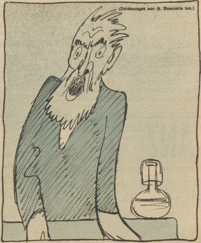
(Zeichnungen von S. Zecovits jun.)

„Diese stinkfaule Bourgeois-Gesellschaft wird niemals sich mehr einen Krieg intrigieren, sonst sind wir da, wir, die Broledarjer die größte Macht der Welt!“