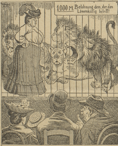
Bierdimpfel (dessen stärkere Hälfte infolge der aus- gesetzten Belohnung den Löwentag betreten hat, wo ihr sotort ein Wüstenkönig die Zähne zeigt): „Dös wird guat, sag, i Cahna, Herr Nachbar! Dös Vieh hat gor ka Ahnung nöti!“

Bitte lesen! Schellenbergs weltberühmtes