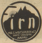
Photo-Artikel sind unübertroffen. Zu beziehen durch Photo-Handlungen.

TANZ Semmler-Rinke Rämistr. 4 (Bellevue-Platz) KURSE Einzelunterricht - Repetitionen