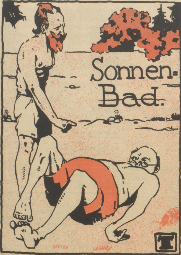
„Hören Sie! Wenn Ihnen die Sonne nicht schaden soll, dann müssen Sie sich unbedingt bewegen.“ „Hä nu, dänn chan ich mi ja emal uf de Buch lege.“