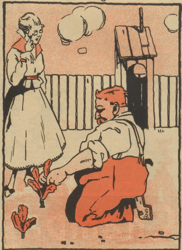
„O, wie schad, das Vergißmeinnicht usj'risse.“ „Nei, Sräulein, das isch gar nüd schad. Ihres Vergißmeinnicht ischt bloß en Kettig.“