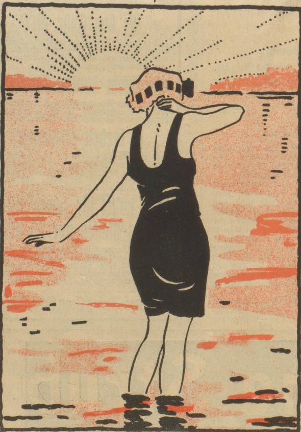
„Wenn au nüd so ehrevoll, so isch es immer na agnehmer, im Wasser, als im Bluet vo sine Sitgenosse z'bade.“