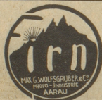
Photo-Artikel verbürgen beste Resultate Zu beziehen nur durch: Photo-Handlungen