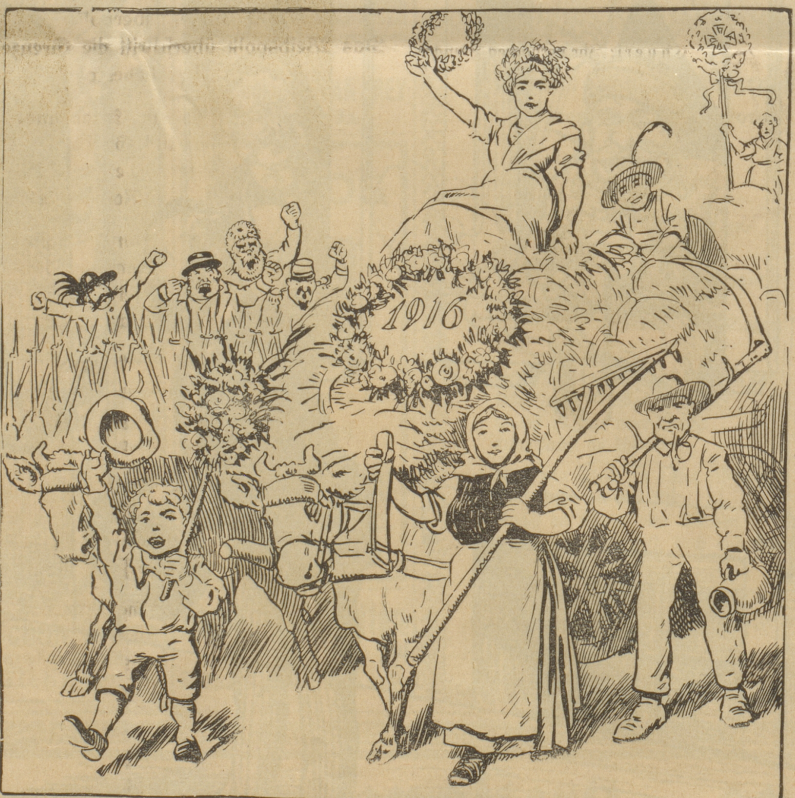
Der Bierverband: Wenn wir nur über den Saun könnten — wir wollten euch das Erntefest schön versalzen.