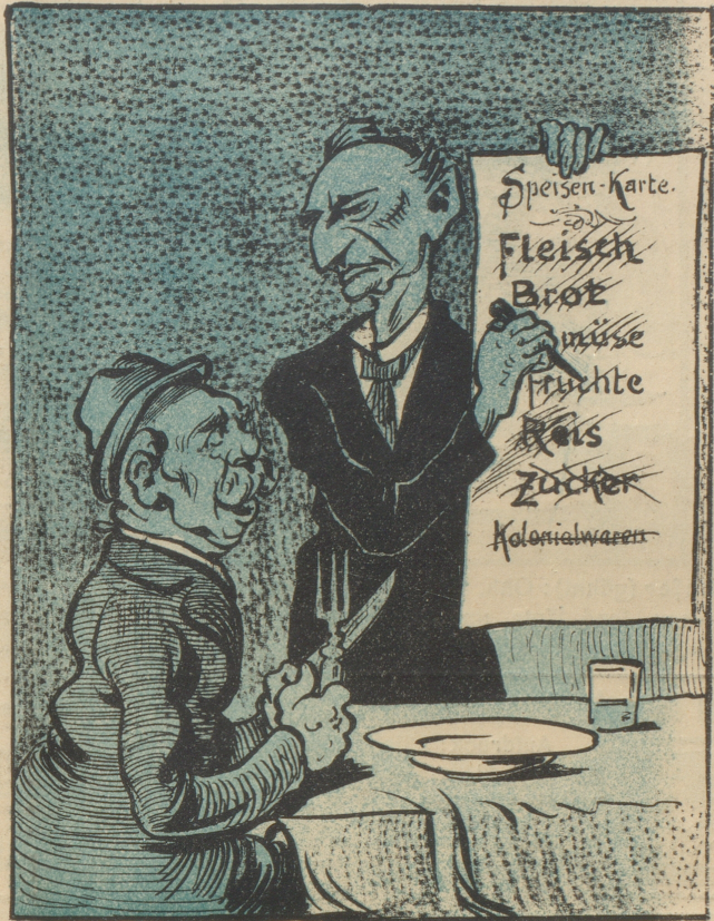
Grieg führt ihn auf Grund der Speisekarte.