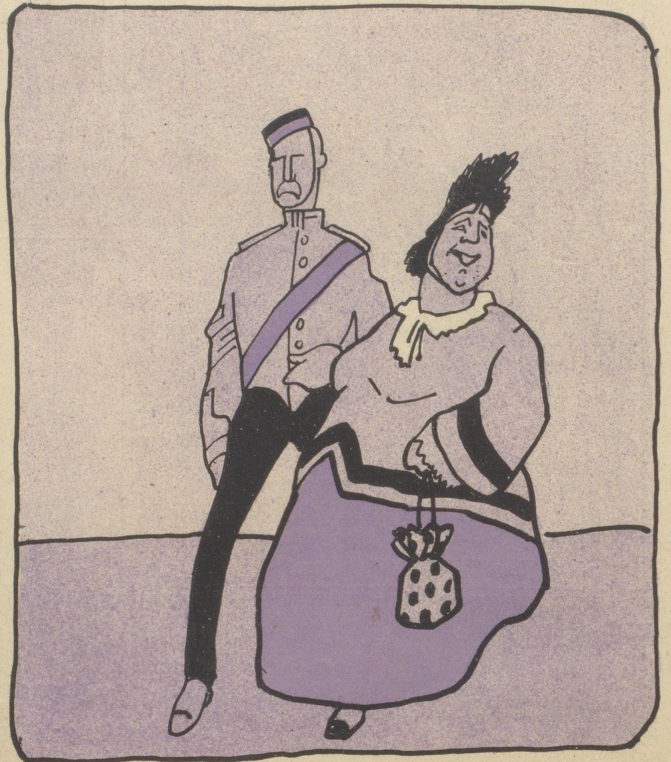
Alte Jungfer: Ich kann der Entente wirklich nicht böse sein.

Soubretten wurden von der Bühne herunter verhaftet.