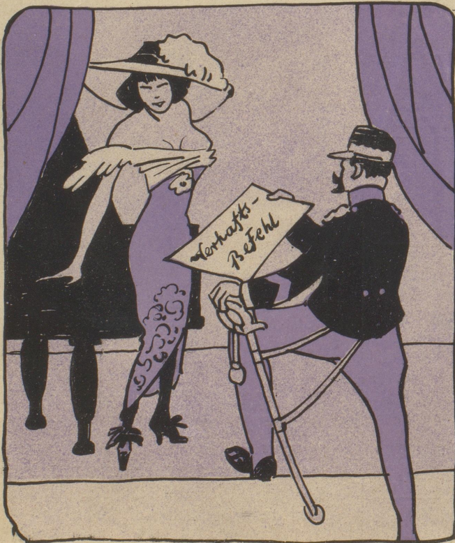
Sängerin: Herr Leutnant ... Sie machen das heute gar amtlich?

Soubretten wurden von der Bühne herunter verhaftet.