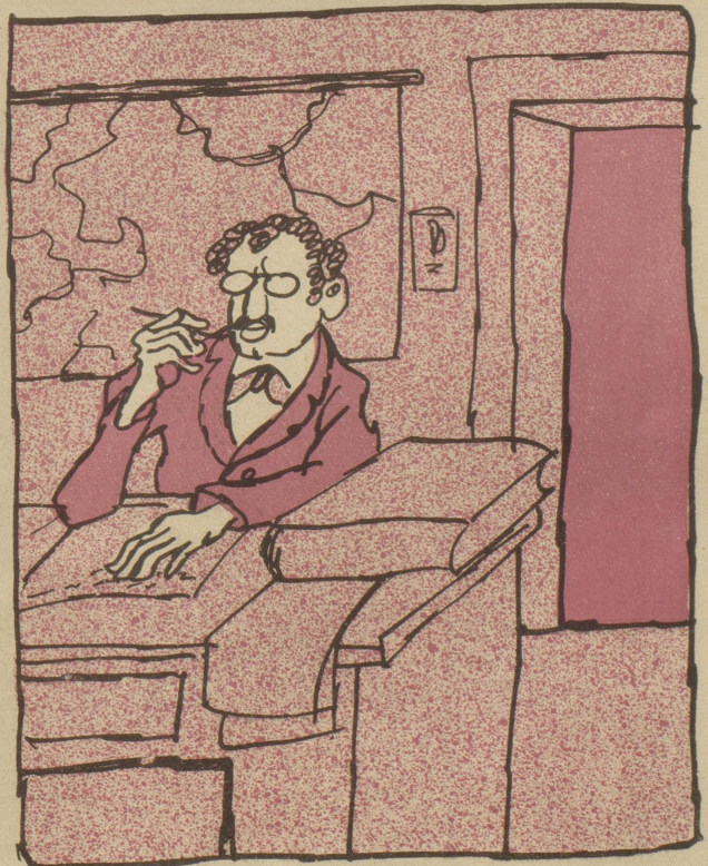
Ein hoher Militär schreibt uns: