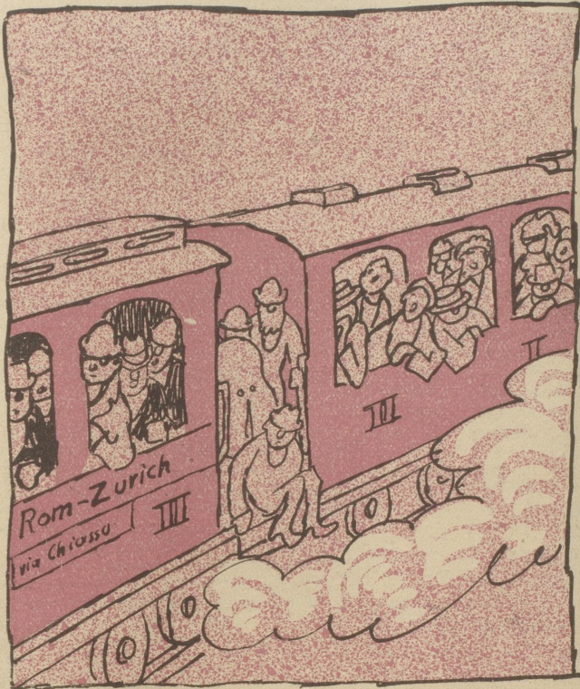
„Wir haben das Leben in Italien in „vollen Zügen“ genossen.“