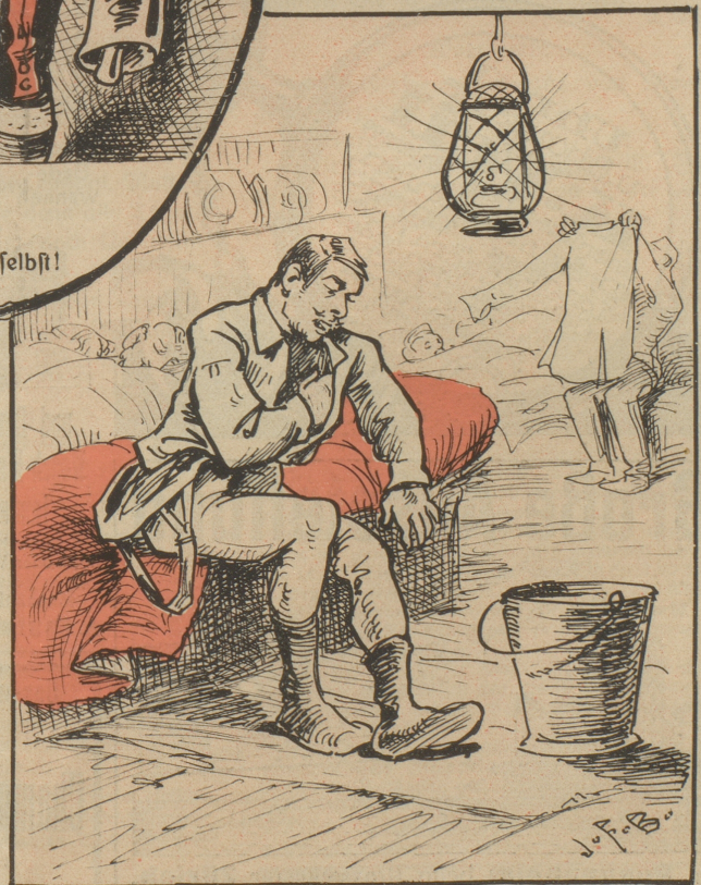
„Ich glaube fast, vo dere Sorte han ich meh übercho als d' Kamerade. Wenn das nu dr Grimm nüd erfahrt!“