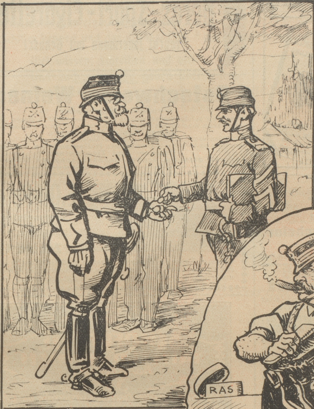
„Sehn Tage à 80 Rappen macht acht Franken, Herr Oberst.“