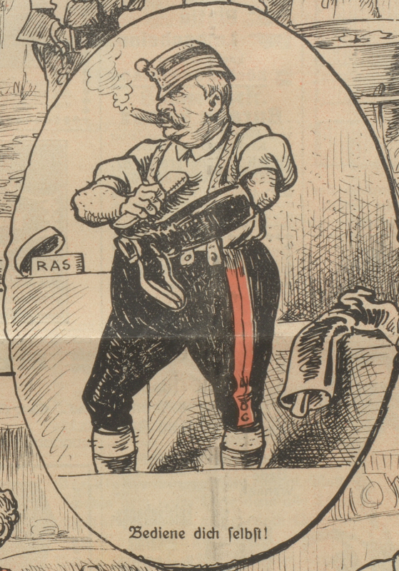
Bediene dich selbst!