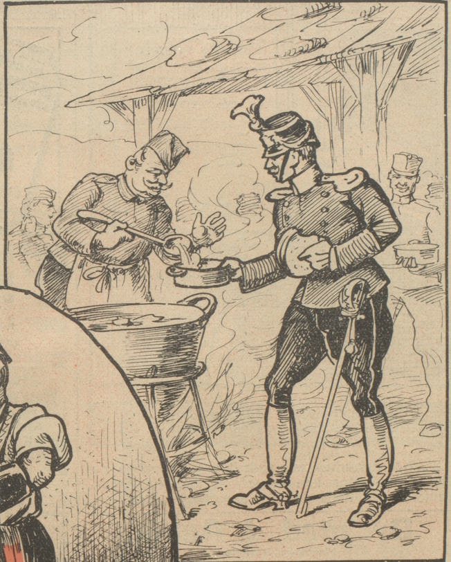
Der Leutnant beim Saffen.