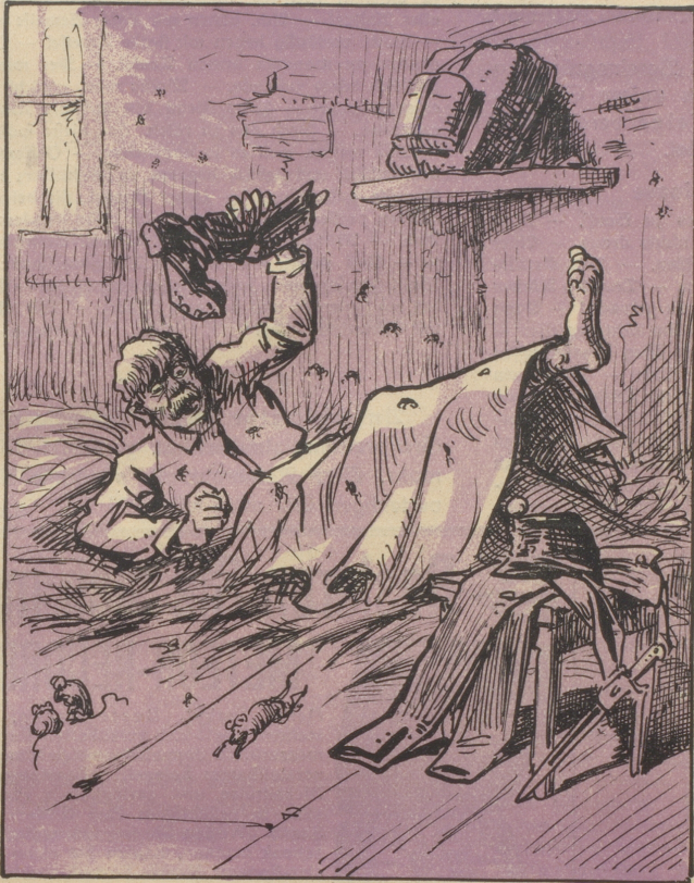
„Ich kann dir das bewegte Lagerleben nicht schildern.“