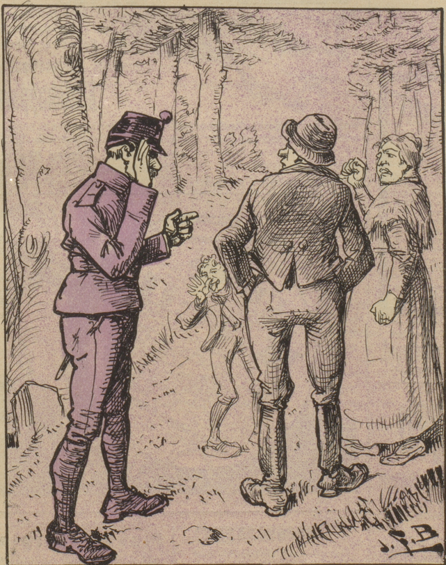
„Die Bevölkerung kommt uns zuweilen sehr liebevoll entgegen.“