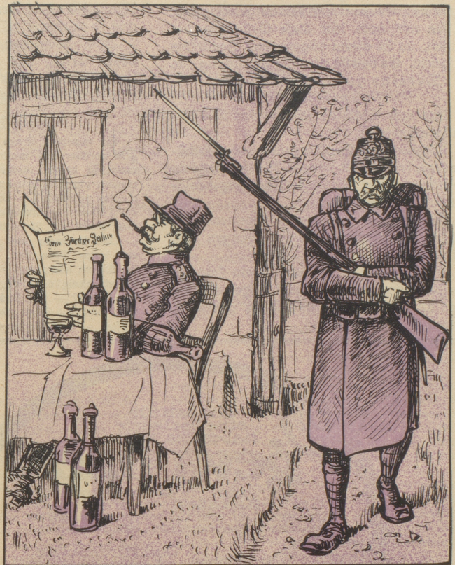
„Der Dienst bei den Batterien ist besonders schwer.“