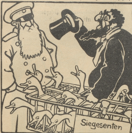
„Gestatten Sie, wo ist da die Spitze des Heeres?“

Fr. Y. Weilenmann, Seefeldstrasse 28, staatl. gepr. u. pat. 1324