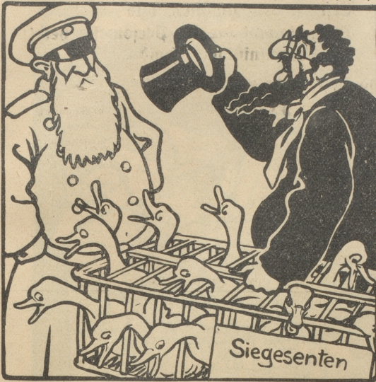
„Gestatten Sie, wo ist da die Spitze des Heeres?“

Fr. Y. Weilenmann, Seefeldstrasse 28, staatl. gepr. u. pat. 1324