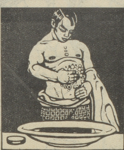
Tägliche Brustwaschungen mit Grolichs Heublumenseife fördern die Lungentätigkeit.