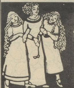
Frauen und Mädchen sind von der wunderbaren Wirkung von Grolichs Heublumenseife überzeugt u. kaufen nur diese.

können wir zufolge unserer grossen Lager immer reichlich dienen. Speziell aufmerksam machen wir auf unsere bedeutend erweiterte Kollektion von feinen Tiroler Tischweinen auf Grund von Einkäufen aus bessere Lagen an Ort und Stelle. Wohl-assortiert sind wir ferner stets in guten italienischen u. spanischen Coupeer- und Tischweinen 1359 Verband ostschw. landw. Genossenschaften Winterthur.