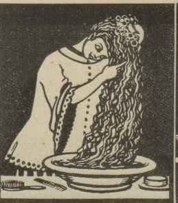
Kopfwaschungen mit Grolichs Heublumenseife entfernen Schuppen, stärken den Haarboden und machen das Haar voll und wellig.

Mütter! Waschet Eure kleinen Lieblinge mit Grolichs-Heublumenseife und auch Ihr werdet Euch an deren Gesundheit und vorzigen Aussehen erfreuen. Grolichs-Heublumenseife ist in allen Apotheken, Droguerien, bei den Coiffeurs, sowie in allen Konsumgeschäften zu haben. Man hüte sich vor Nachahmungen und nehme nur solche Heublumenseife, die aus Brünn kommt und Grolichs-Wild und Blumen trägt. Mit einer gefälschten Heublumenseife würdest Du, lieber Vater, diese Erfolge nicht erzielen. Nur Grolichs-Heublumenseife aus Brünn ist eine Gesundheits- und Schönheitsseife sans rival.