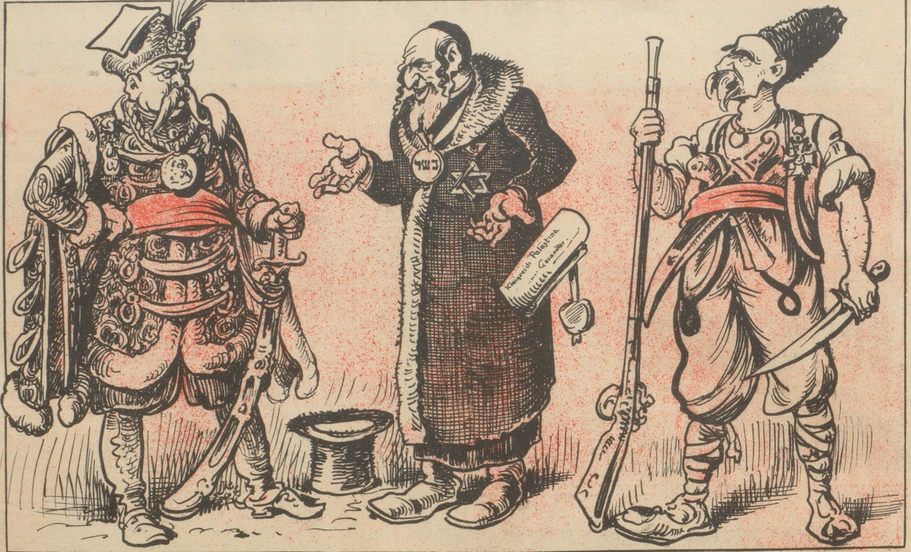
Der Weltkrieg hat also doch einen Zweck gehabt. Er verarmte die Welt um Menschen und bereicherte sie um — Diplomaten.