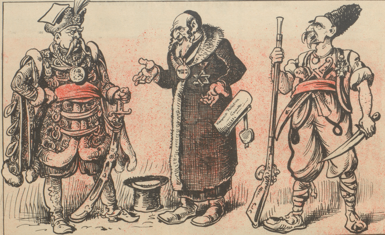
Der Weltkrieg hat also doch einen Zweck gehabt. Er verarmte die Welt um Menschen und bereicherte sie um — Diplomaten.