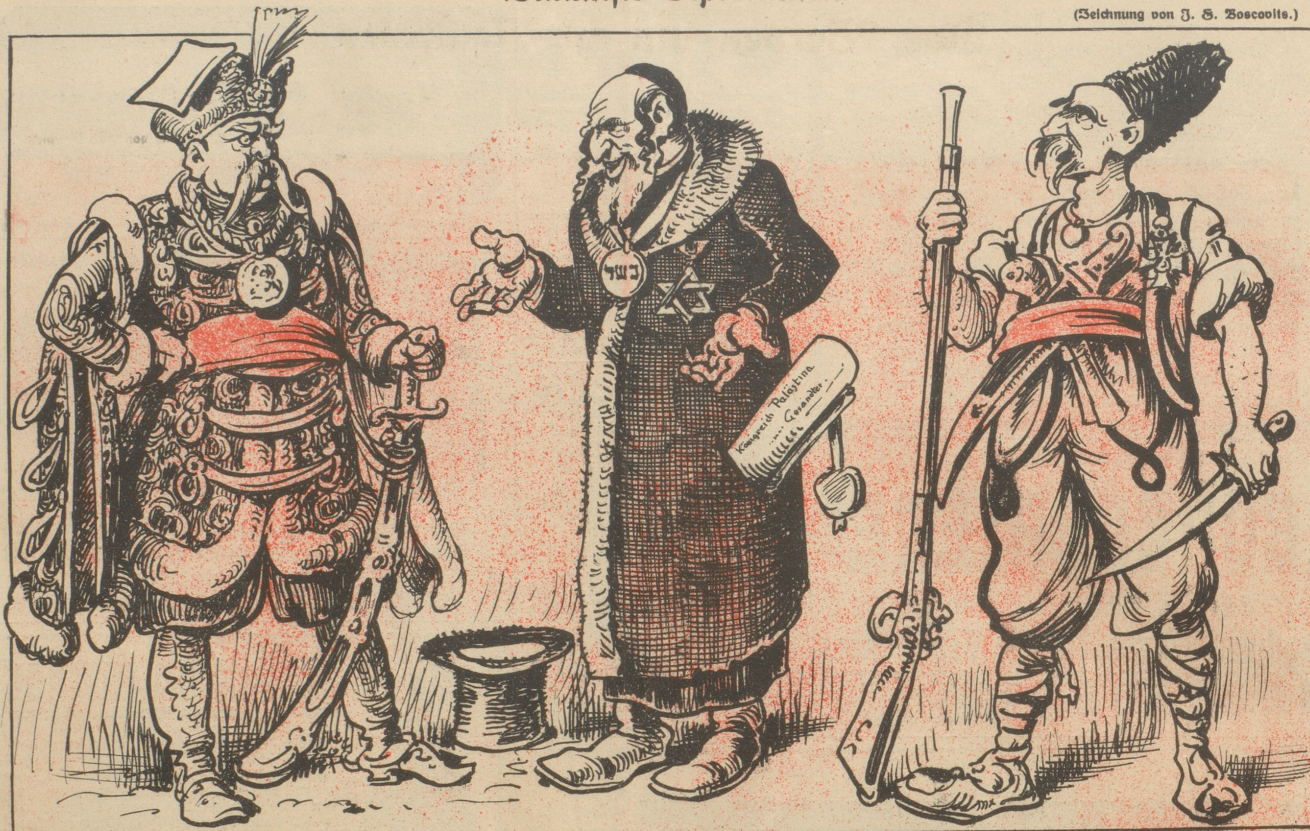
Der Weltkrieg hat also doch einen Zweck gehabt. Er verarmte die Welt um Menschen und bereicherte sie um — Diplomaten.