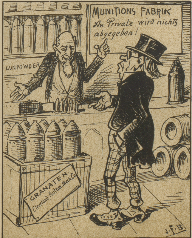
Nutzloser Versuch der Munitionsergänzung oder das wahre Selbstmord-Motiv.