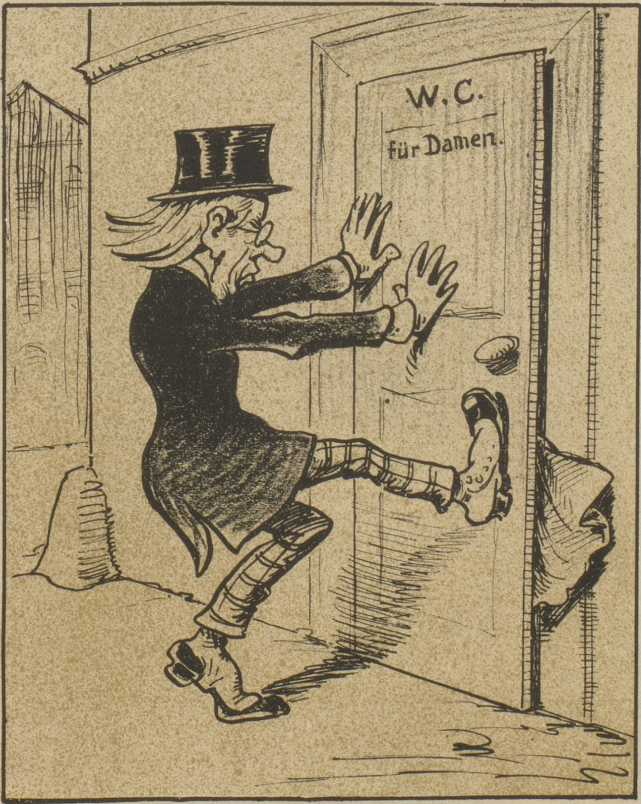
Seine Frau verschwindet unter verdächtigen Umständen.