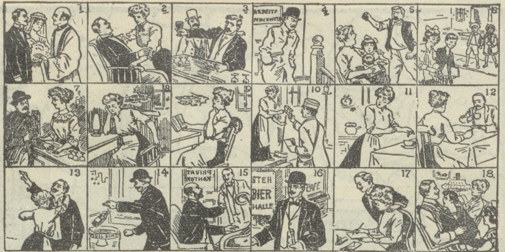
Diese 18 Bilder erzählen eine ganze Geschichte. Ein Kind kann sie verstehen.