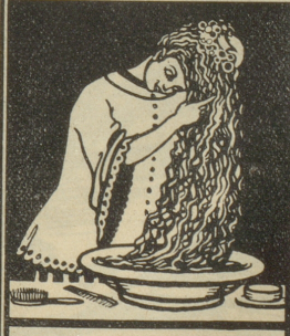
Kopfwaschungen mit Grolichs Heublumenseife entfernen Schuppen, stärken den Haarboden und machen das Haar voll und wellig.