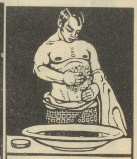
Tägliche Brustwaschungen mit Grolichs Heublumenseife fördern die Lungentätigkeit.