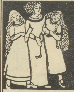
Frauen und Mädchen sind von der wunderbaren Wirkung von Grolichs Heublumenseife überzeugt u. kaufen nur diese.

Grosse, neu renovierte Säle für Hochzeiten, Gesellschaften und Vereinsanlässe. Prächtiger, schattiger Garten mit Rosenlauben direkt am See. Ponton für Klub- und Motorboote. Exquisite Küche und Keller. — Spezialität: Fische. Pensionspreis von 5 Fr. an. 1275 Telephon-Nr. 10 — Bad. Elektr. Licht. — Telephon-Nr. 10