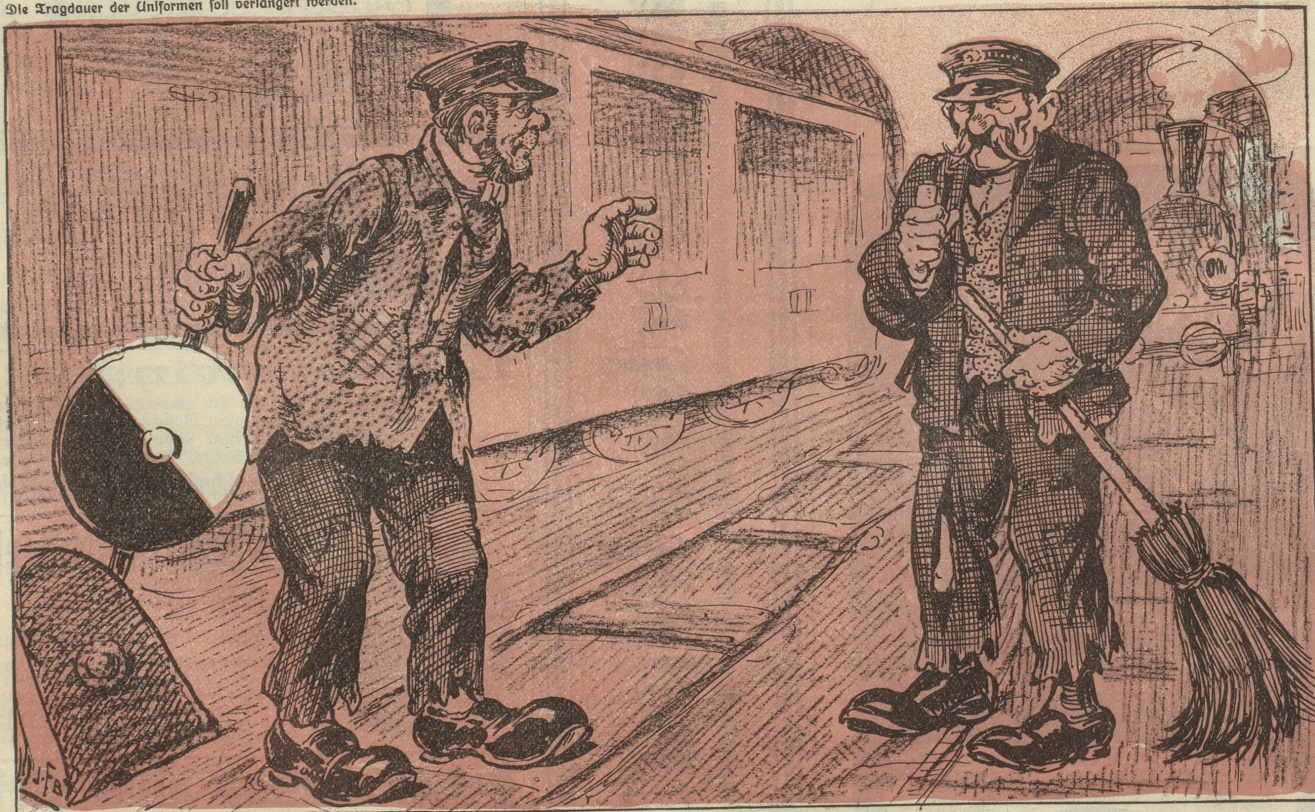
„Du, Chueri, ob's jeh denn ächt zu-m'ene neue Paar Hose langet?“

Die Tragdauer der Uniformen soll verlängert werden.