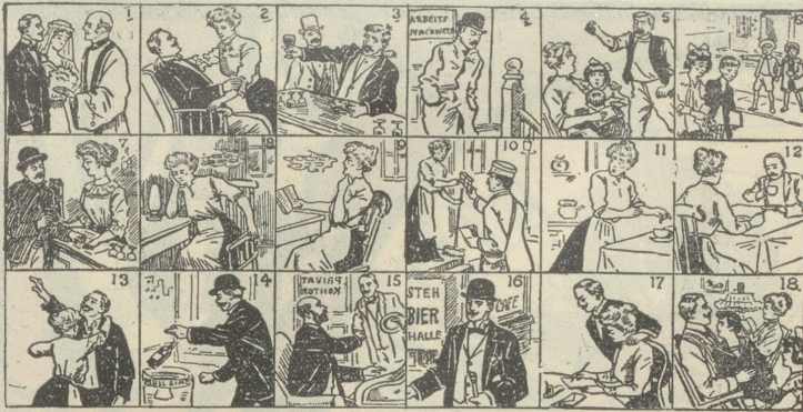
Diese 18 Bilder erzählen eine ganze Geschichte. Ein Kind kann sie verstehen.