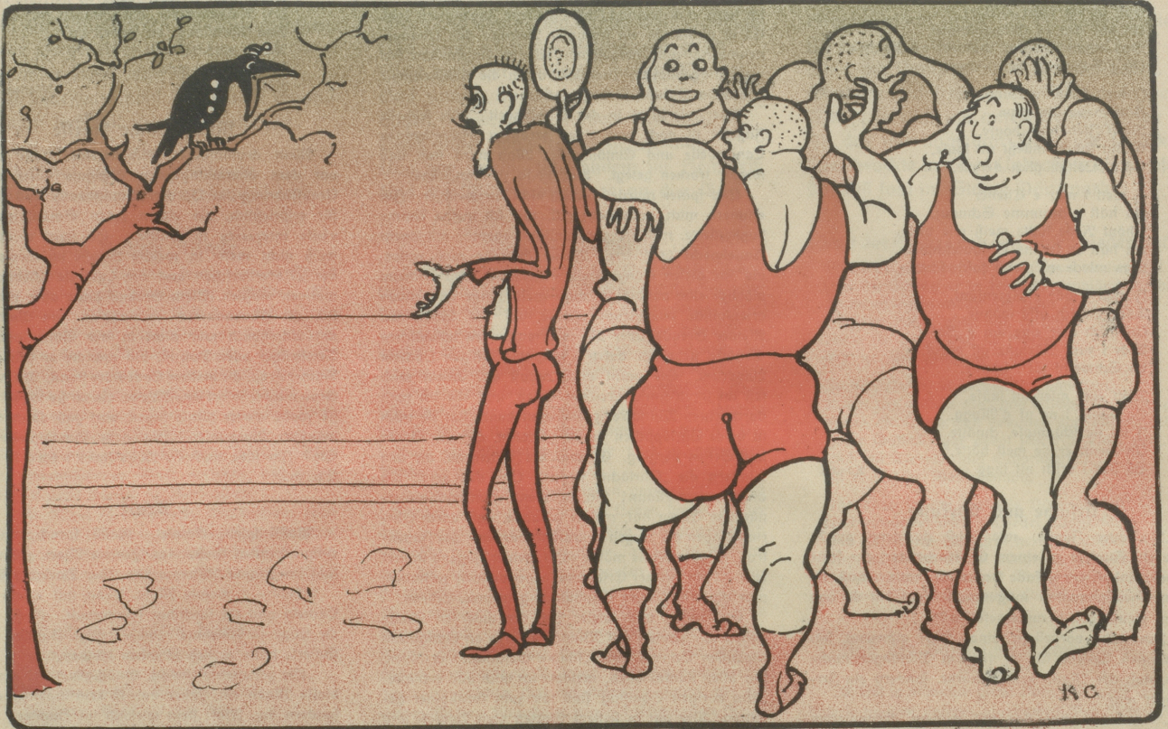
Projektiertes Wandgemälde für das Corfotheater.