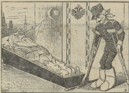
Das Ende des Balkanrieges Der „kranke Mann“ ist tot, es lebe der „kranke Mann“!