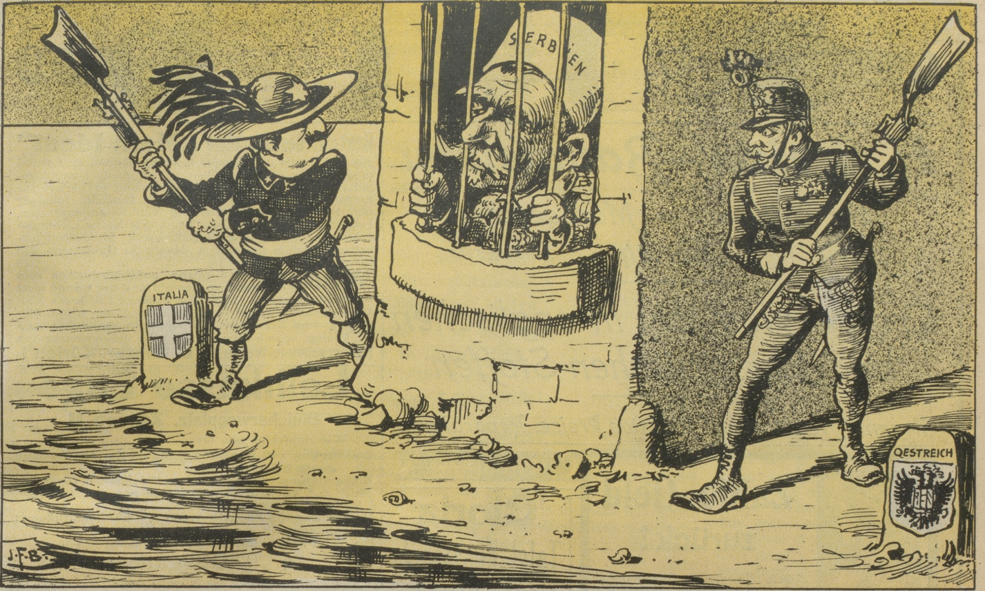
mit beschränkter Aussicht