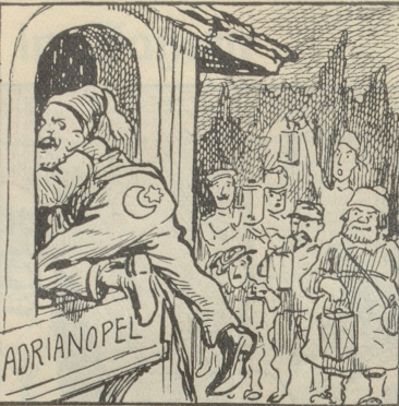
Ein Wohnungseinschleicher vor den Augen der Wacht- und Schließgesellschaft