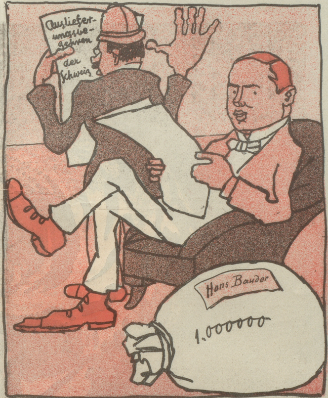
aber noch schwieriger ist es, Einen wieder herauszubekommen.