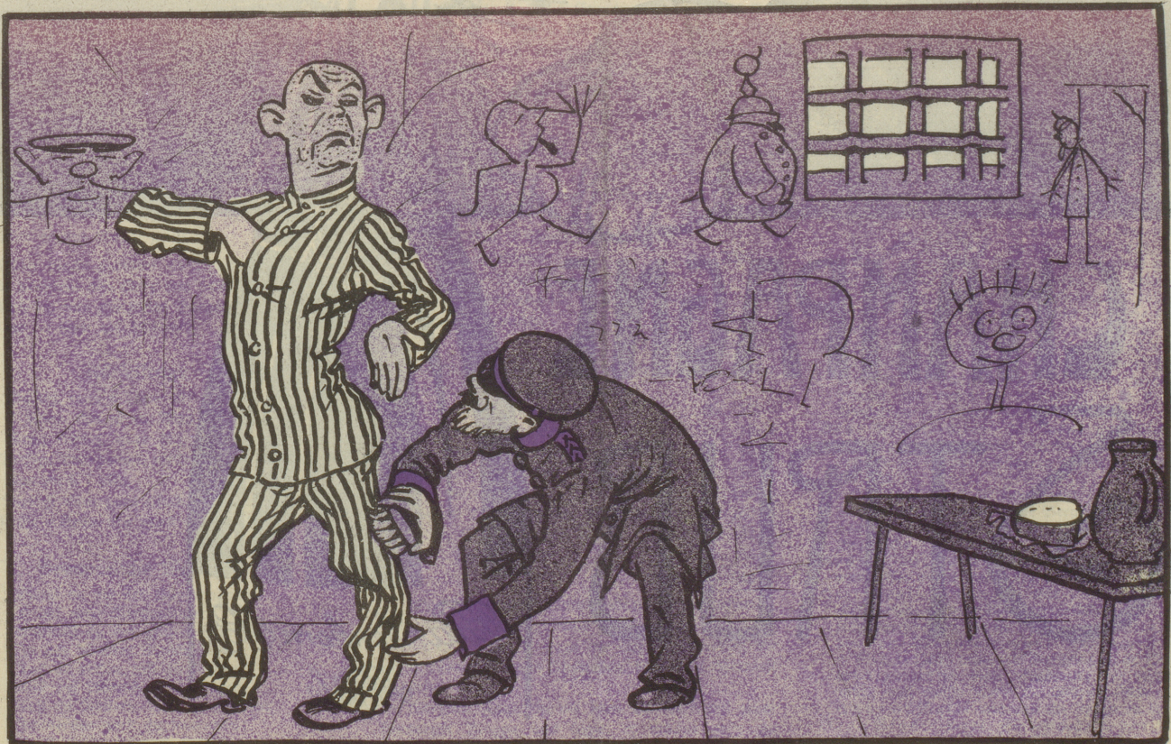
„Wenn Sie mich nicht aufmerkfamer bedienen, so lasse ich mich umtaufen und gehe zur Konkurrenz.“