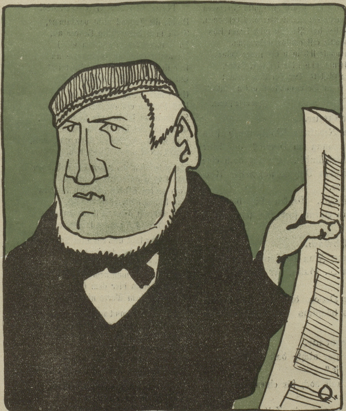
Da heißt Optimist, dann wieder Pessimist; das ist sicher wieder so ein neuer Kunstdünger. Ich bleibe beim Kuhmist!