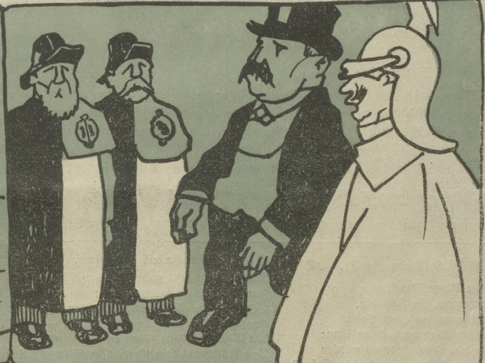
4. Eurer Majestät möchten die Standesweibel von Basel und Appenzell Inner-Rhoden ihre Aufwartung machen. Sie schmeicheln sich, daß diese Kantone die gleichen Landesfarben aufweisen wie Preußen!