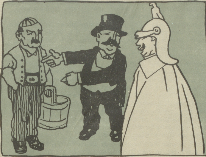
1. Hier, Majestät, ist ein lebendiger Käfer aus dem Emmental, von dem das Wort Kaiser abtammen soll.