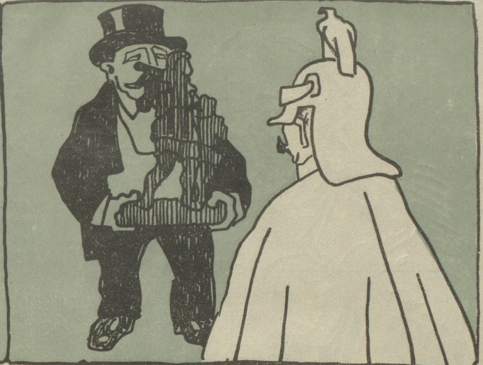
2. Gestatten, Majestät, Ihnen hier in Schokoladeguß Ihren Vornamensvetter Wilhelm Tell für dero allerhöchsten Frau Gipsusi untertänigst zu überreichen.