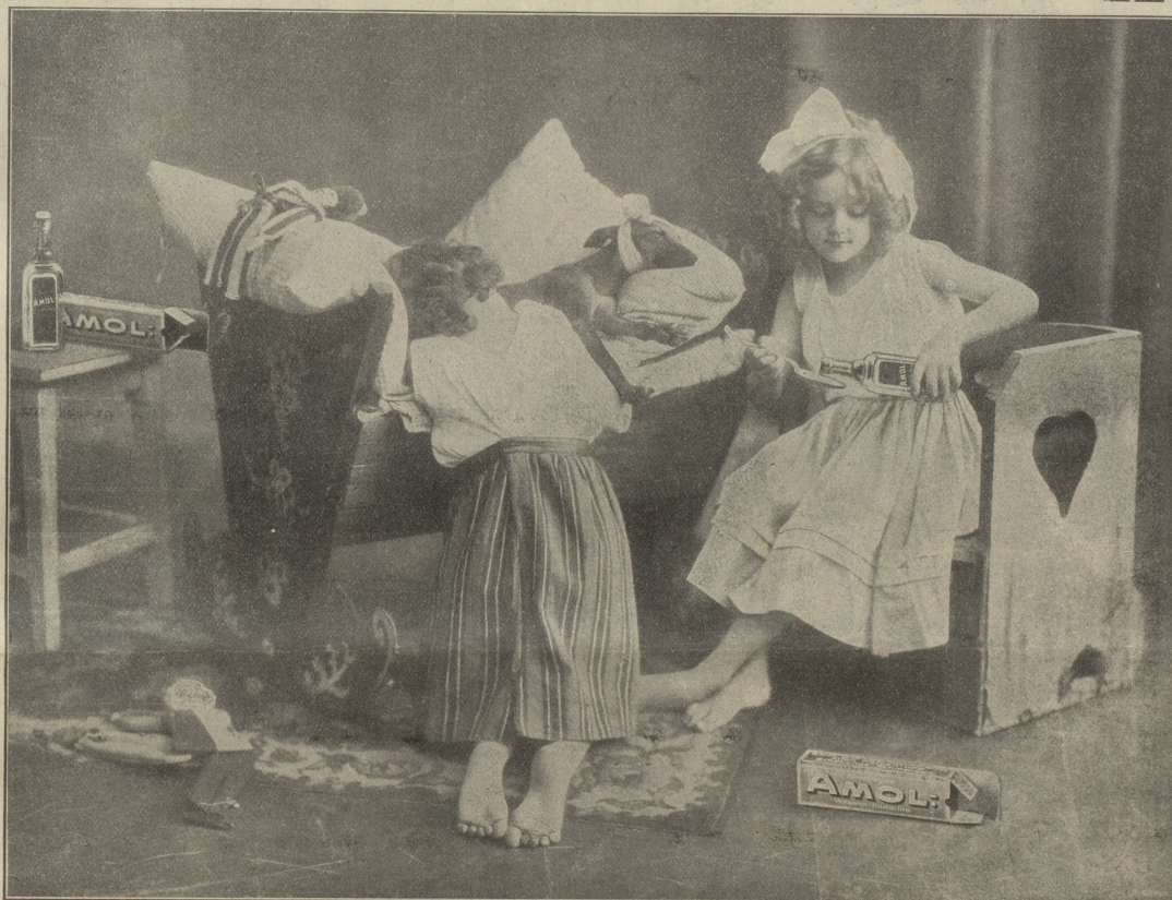
Bedeutung des Bildes: Siehe Nr. 45 des „Nebelspaltes“ vom 4. November 1911.

AMOL ist ein hervorragendes, wohlriechendes Kosmetikum, erfrischend, stärkend, belebend und desinfizierend.