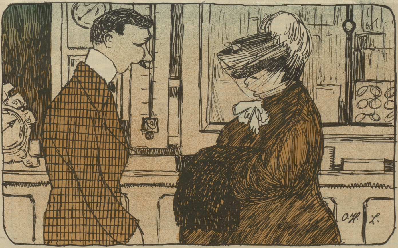
Chöntet Sie mir es Thermometer hei schicke? — Gewiß! Nach Celsius! — Nei — nei — nach Pfäffike!