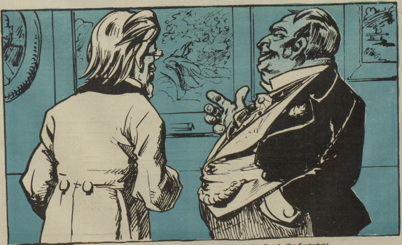
Parvenu: Nu, wie gefallen Ihnen diese Bilder? Nicht wahr, prachtvoll, und alles Handarbeit!