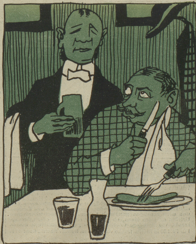
Kellner: Ist das Beefsteak vielleicht etwas zähe? — Gast: Macht nix, ich werde schon fertig damit, ich bin gelernter Bohgerber...