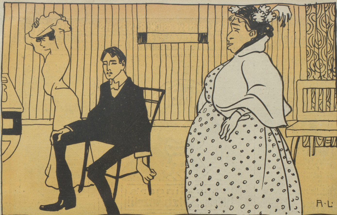
Schwiegermama (zu Besuch): Was soll ich denn morgen für ein Kleid anziehen? — Schwiegersohn: Das Reisekleid, liebe Schwiegermama...