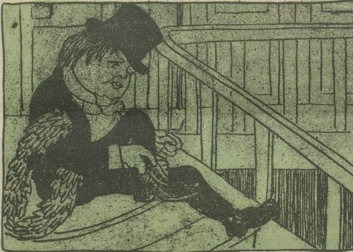
„Am stillen Herd zur Winterszeit“ — — (Meisterfing.)