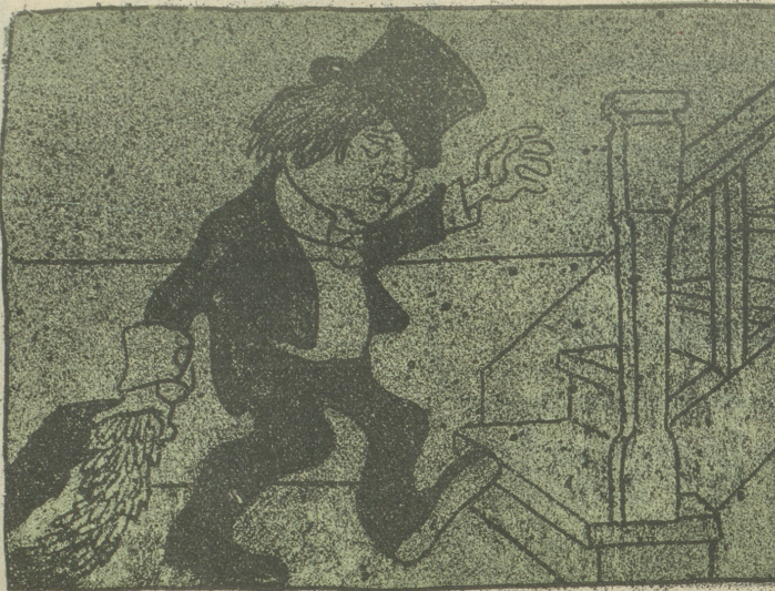
„Gott, — welch' Dunkel hier!“ (Florestan im Fidelio.)

(Herrn Schwälbles nächtliche Taten, — in Opernzitaten.)