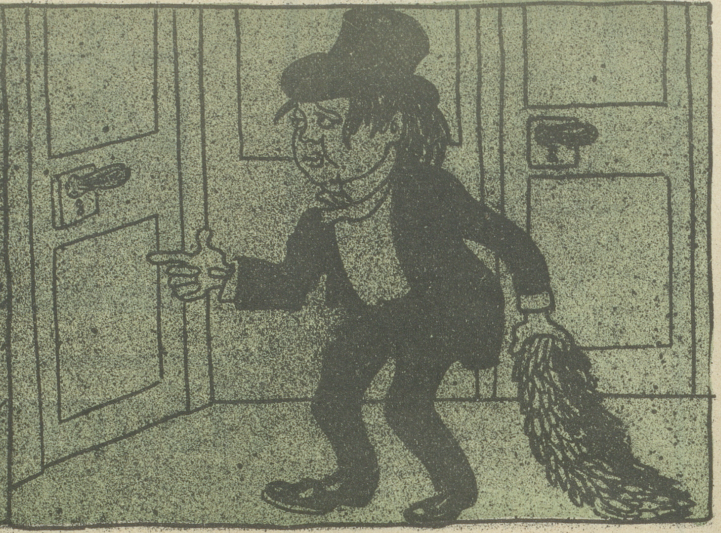
„Da seh' ich noch eine Tür, Vielleicht find ich den Eingang hier!“ (Tamino in der Zauberflöte.)