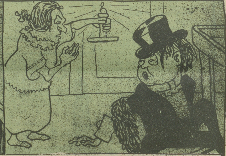
„Lobern zum Himmel seh' ich die Flammen!“ (Troubadur.)