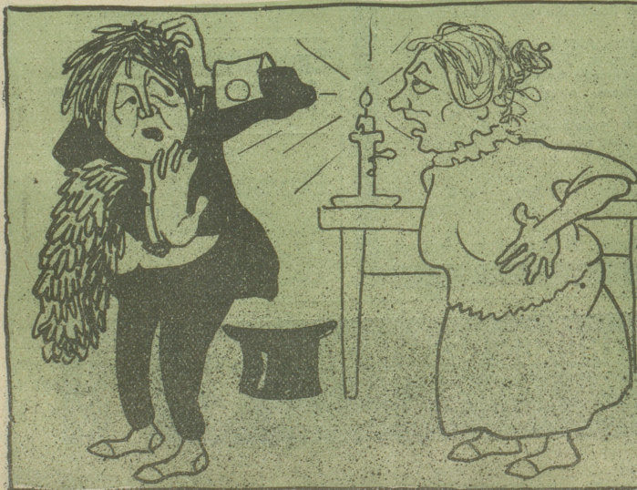
„Wie sollst du mich befragen —!“ (Vohengrin.)