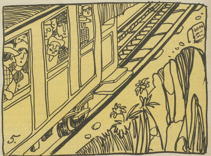
5. Wer in die Schweiz reißt, so wie heuer, Dem blühe eine Bergbahnsteuer!