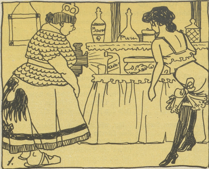
1. Was seh ich? Ha! Ddoh! Javoh! Das kann versteuern man, — jawohl!