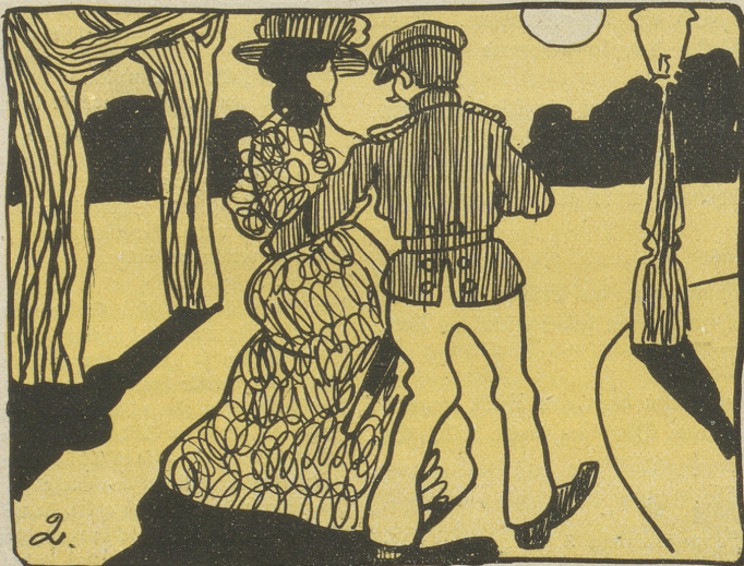
2. Auch Süßholz läßt sich gut versteuern, Wenn Pärchen Liebesorgen feiern!