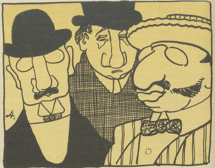
4. Von Riechorganen allzulänglich Gibt's — Hurrah! — Steuern überschwenglich!