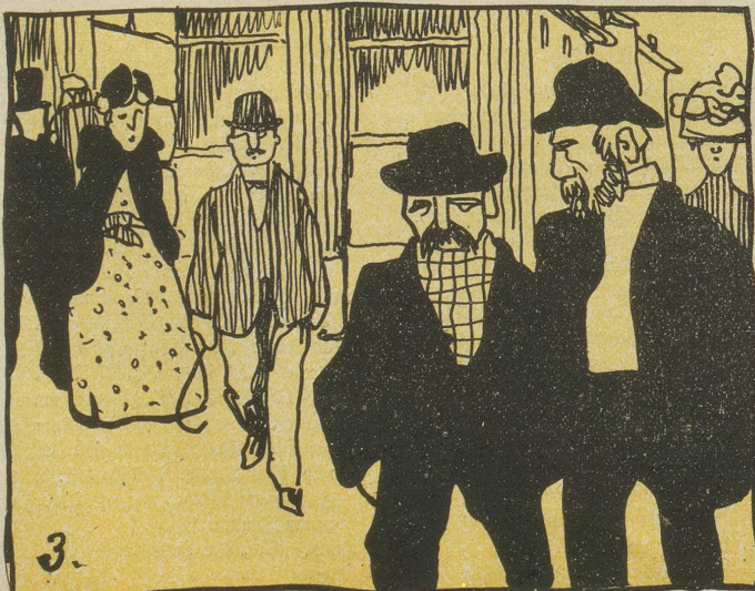
3. Wer heut nicht fliegt, fährt, autorumpelt, Nur auf höchstteig'nen Füßen humpelt, Soll, nicht zu billig, nicht zu teuer, Bezahlen eine Asphaltsteuer.