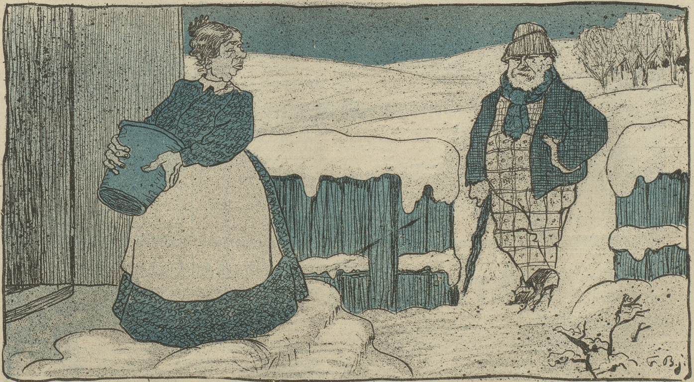
„Ach Madame, wollen Sie nicht den Schnee vor Ihrem Hause wegschaufeln lassen?“ — „Gewiß.“ — „Schön, wenn Sie mir ein gutes Trinkgeld geben, dann schicke ich Ihnen einen Andern der's tut.“