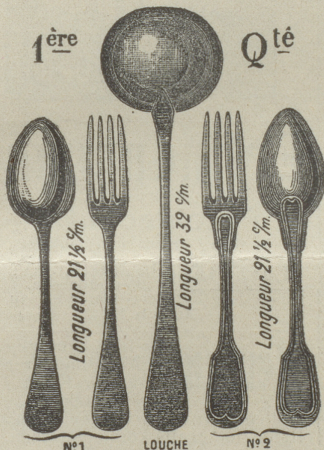
Zur gef. Auswahl Form Nr. 1 oder 2.

Verlangen Sie Spezial-Kataloge für Uhren.