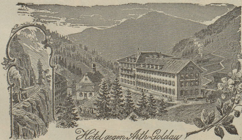
Hotel gegen Arth-Goldau

„Das Klösterli ist der geschützte Kurort des Rigi, und dennoch entbehrt es in der weiten Mulde der Sonne nicht, ist selten von Nebeln heimgesucht, hat eine milde, sich ziemlich gleichbleibende, keinen grossen Schwankungen unterworfenen Sommertemperatur u. gewährt durch den Anblick der umliegenden grünen Alpweiden, Felsen und Waldungen das freundlich Angenehme eines abgeschlossenen, stillen Bergtales mit köstlicher, reiner, mild-erregender Luft. Der Aufenthalt erweist sich namentlich für sensible, reizbare, noch schwache Rekonvaleszenten, für Lungenkranke von mittlerer Resistenzfähigkeit, für Nervenkranken und Geschwächte, welche einer allmählichen anhaltenden Stärkung und Erfrischung bedürfen, als sehr heilsam. — Nahrung, Bäder, Milch, Molken, treffliches Trinkwasser, nahe Waldung mit Ruhebänken und die von den herrlichsten Aussichtspunkten beglückten Spazierziele dienen als erfolgreiche Adjuvantien.“