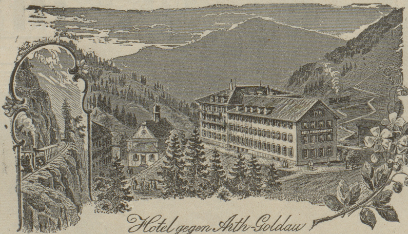
Hotel gegen Arth-Goldau

„Das Klosterli ist der geschützte Kurort des Rigi, und dennoch entbehrt es in der weiten Mulde der Sonne nicht, ist selten von Nebeln heimgesucht, hat eine milde, sich ziemlich gleichbleibende, keinen grossen Schwankungen unterworfenen Sommertemperatur u. gewährt durch den Anblick der umliegenden grünen Alpweiden, Felsen und Waldungen das freundlich Angenehme eines abgeschlossenen, stillen Bergtales mit köstlicher, reiner, mild-erregender Luft. Der Aufenthalt erweist sich namentlich für sensible, reizbare, noch schwache Rekonvaleszenten, für Lungenkranke von mittlerer Resistenzfähigkeit, für Nervenranke und Geschwächte, welche einer allmählichen anhaltenden Stärkung und Erfrischung bedürfen, als sehr heilsam. — Nahrung, Bäder, Milch, Molken, treffliches Trinkwasser, nahe Waldung mit Ruhebänken und die von den herrlichsten Aussichtspunkten beglückten Spazierziele dienen als erfolgreiche Adjuvantien.“