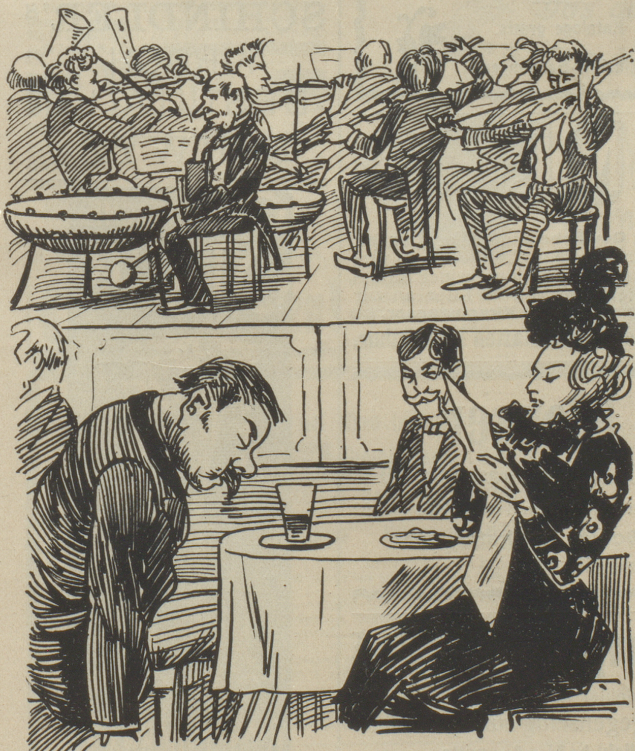
Rentier Fabi (im Traum): „Na, das ewige Gedudel“ ...