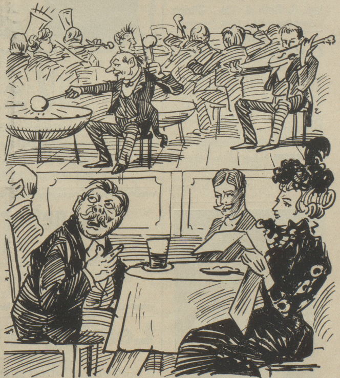
Rentier Fabi (plötzlich durch einen Paukenschlag geweckt): „Oha, endlich wird angezapft!“