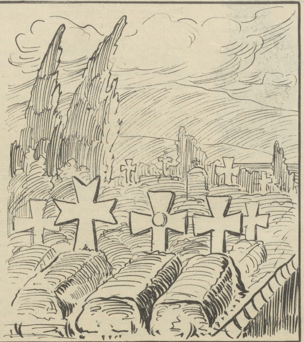
Die Kreuze seiner Soldaten.