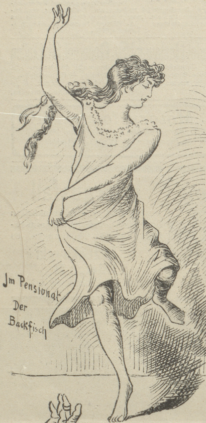
Im Pensionat Der Backfisch