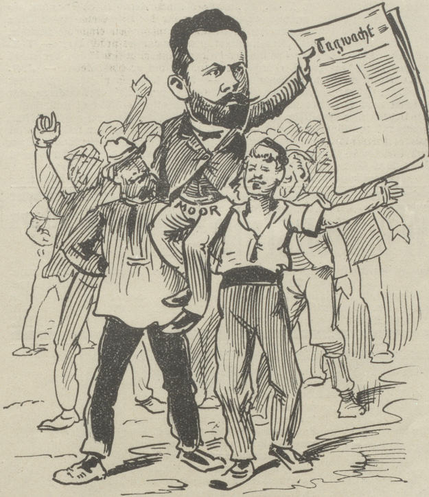
kann der Moor, der seine Schuldigkeit getan hat, noch lange nicht gehen, deswegen wird er getragen!