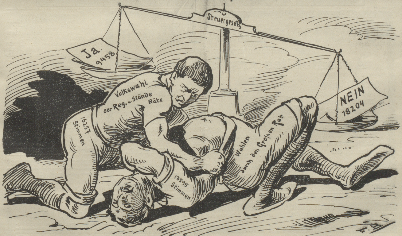
haben im Aargau, wie vorstehend, eine „authentische Interpretation“ erfahren.