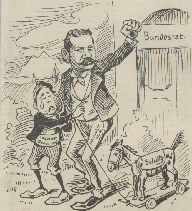
hat im Ständerat das oben beschriebene Endspiel gefunden.