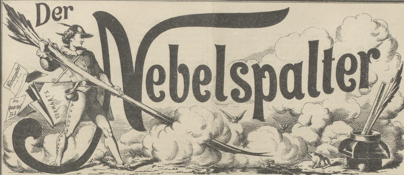
Lith v. Butz & Fleursheimer