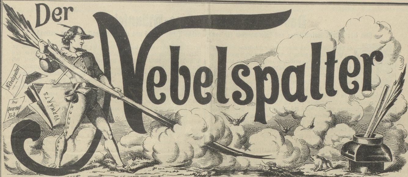
Lith v. Butz & Fleursheimer