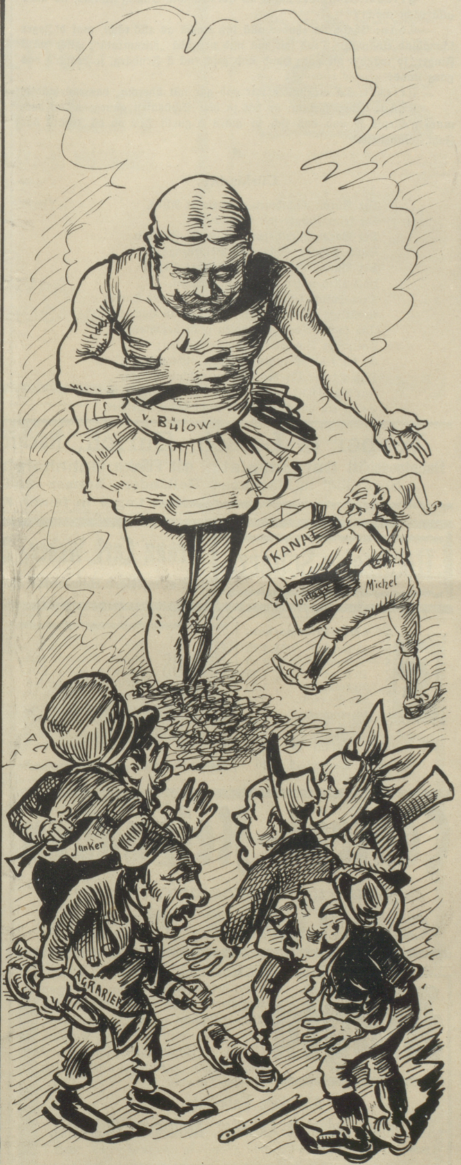
„Hau . . .“