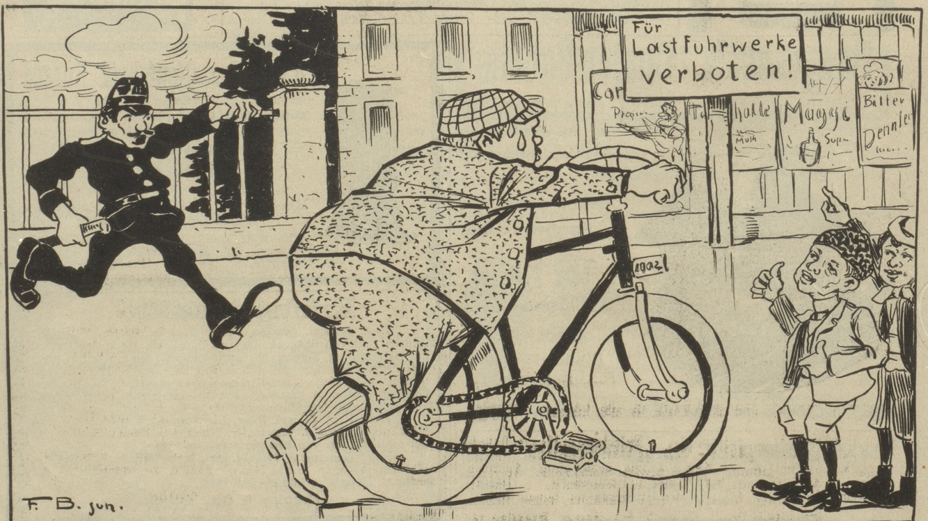
Gensdarm: „Heh, Manno, chönnit d'r nüd läle?“