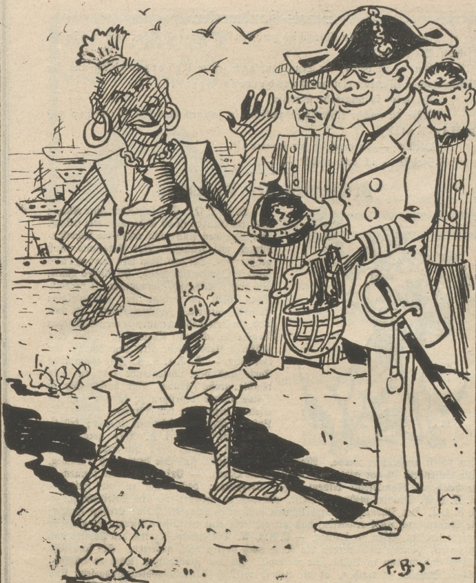
Maulkorb und Pickelhaube überzeugen auch die Wilden, daß das tausendjährige Reich der „gepanzerten Faust“ beginnt.